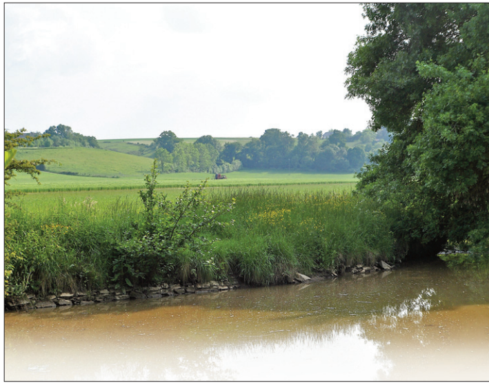
Le niveau des cours d'eau est au plus bas.

Nuisibles. Un pôle sanitaire du végétal est à l'étude à Beaucouzé. Il accueillera les services de la Fredon et le rôle du FDGDON sera élargi.