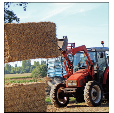
La FDSEA met en place une opération d'achat groupé de paille.

Paille. Face au risque toujours accru de pénurie de fourrage, les céréaliers sont appelés à ne pas broyer la paille. Une opération de solidarité se mettra en place dans de nombreux départements, dont le Maine-et-Loire pour assurer et rassurer les éleveurs. Des échanges paille/fumier se mettent en place. Des dérogations sont obtenues auprès du préfet de Maine-et-Loire.