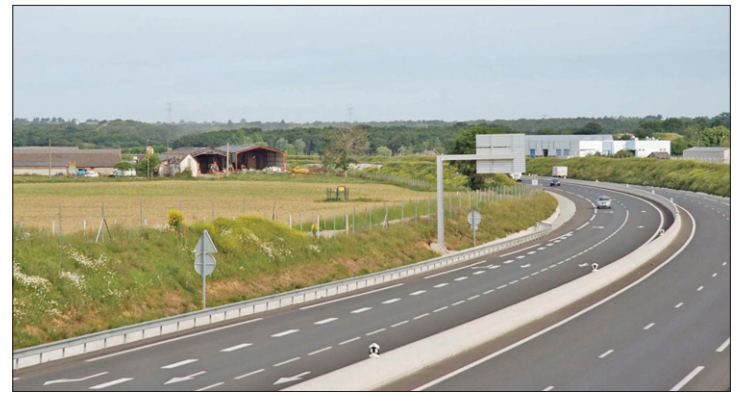
À gauche, le Gaec du Fléchet, à droite, la zone urbanisée. La Chambre d'agriculture est catégorique : "la RD 775 doit matérialiser une limite d'urbanisation".

Foncier. Les agriculteurs d'Avrillé sont inquiets : un projet d'extension de la zone urbanisée mettrait en péril l'avenir des exploitations. Une fois de plus, les responsables professionnels en appellent à une gestion raisonnée et concertée du foncier.